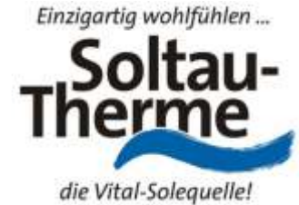
📍 19 km Soltau Therme

... und es gibt noch vieles mehr zu entdecken!