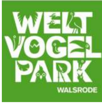
📍 40 km Weltvogelpark Walsrode