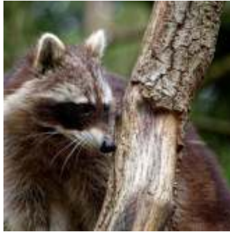
📍 23 km Wildpark Lüneburger Heide