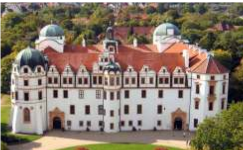
📍 64 km Celle, Schloss