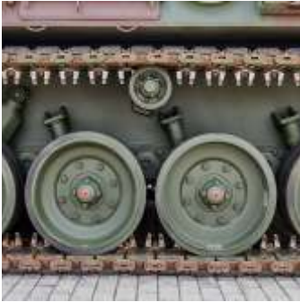
📍 20 km Deutsches Panzermuseum