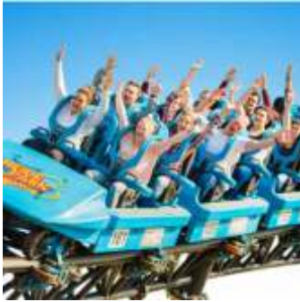
📍 16 km Heidepark Soltau