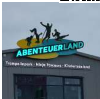
📍 1,4 km Abenteuerlabyrinth