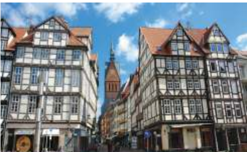
📍 96 km Hannover, Innenstadt