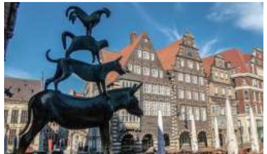
📍 101 km Bremen, Stadtmusikanten

Weitere Infos unter www.camping-brunautal.de