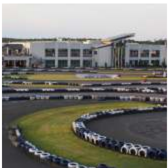
📍 1,5 km Kart- und Bowlingcenter