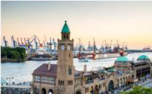
📍 60 km Hamburg, Landungsbrücken