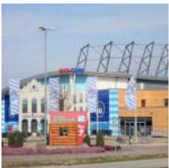
📍 1,9 km Snowdome Skihalle