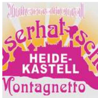
📍 5,8 km Iserhatsche - Das Heidekastell