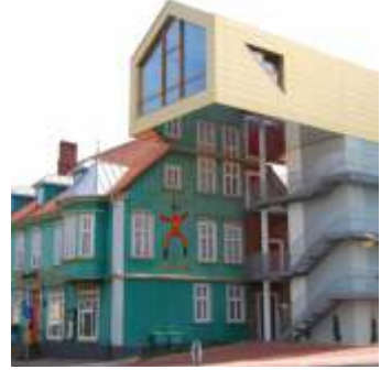
📍 19 km Spielemuseum Soltau