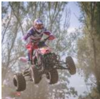
📍 1,0 km Quadbahn Bisingen