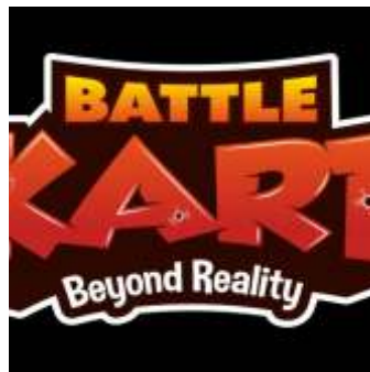
📍 1,4 km Battle-Kartbahn