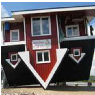
📍 1,4 km Das verrückte Haus