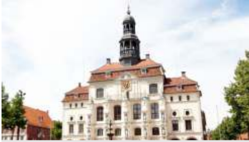
📍 38 km Lüneburg, Rathaus