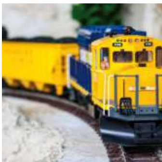
📍 1,9 km Modellbauwelten