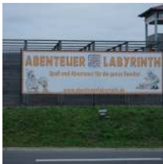
📍 1,4 km Indoor-Trampolinpark